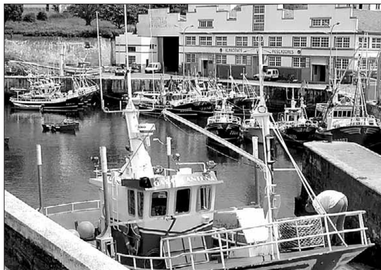
Puerto de Vega.