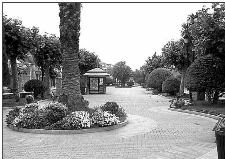
Parque de La Caridad, en El Franco.

romano. La tercera ruta que propone el parque descubre el patrimonio que tiene su origen en el intenso vínculo que han tenido los habitantes de estas tierras con el mar. Playas, acantilados, puertos, faros, ríos, cascadas, tradiciones como la caza de ballenas o los innumerables ejemplos de arquitectura indiana, se ofrecen al visitante en el itinerario Las historias del mar , que parten de la puerta de Puerto de Vega (en construcción).