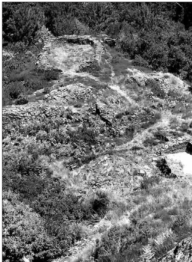
Castro de Pencia, en Boal.