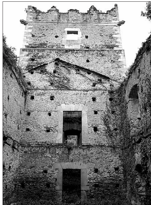
Torre del Palacio de Anleo, en Navia.