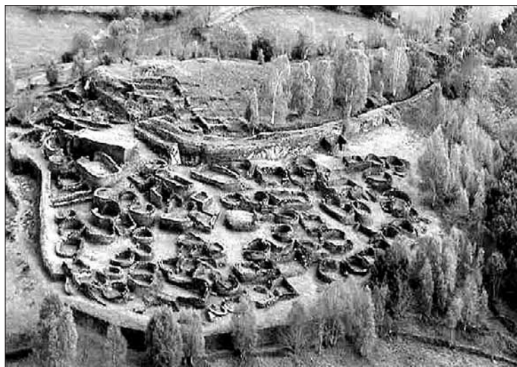
Castro de Coaña.

El segundo recorrido, Los señores de las casas palacio , se inicia en la futura puerta de Tapia de Casariego (cuya apertura se prevé para el próximo año) y recorre el rico patrimonio arquitectónico, etnográfico y folclórico heredado durante más de mil años de dominio feudal y eclesiástico, tras la caída del imperio